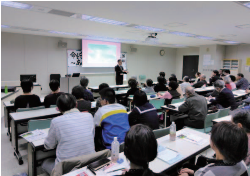
防災についての認識を新たにしました

を、映像を交えてわかりやすく語ってくださいました。 受講生のみなさんは「最後に自分の命を守るのには自分自身」という言葉に深くうなづいていました。